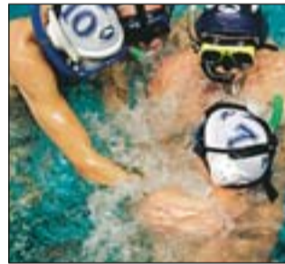
Både handtag och famntag.