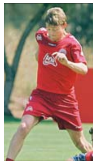
Jon Dahl Tomasson får rycka in som kapten när Thomas Helveg är borta.